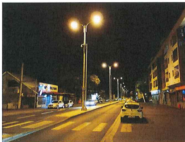
Installation d'éclairage urbain d'ancienne génération : que faudrait-il améliorer pour qu'il soit utile, maîtrisé et responsable ?

La responsabilité doit aussi concerner la prise en compte de l'ensemble du cycle de vie du matériel installé. Le remplacement de matériel encore parfaitement fonctionnel, ou l'installation de solutions technologiques dont les matériaux constitutifs nécessitent des processus extractifs polluants, et/ou sans solutions satisfaisantes de recyclage, devraient ainsi être des points questionnés dans les projets neufs ou de rénovation.