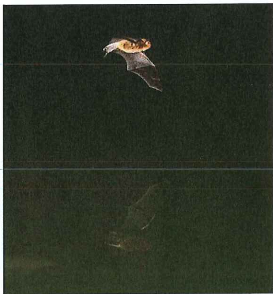
Chiroptère en vol. Les chiroptères sont particulièrement impactés par la pollution lumineuse

Cette publication est destinée aux décideurs, techniciens et professionnels concernés par la question: bureaux d'études, concepteurs lumière, fabricants, installateurs, urbanistes, aménageurs, écologues, etc.