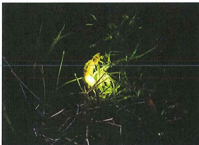
Le ver luisant émet de la lumière pour être repéré par un partenaire pour la reproduction - la lumière artificielle perturbe son comportement

Il y a donc un intérêt fort à collaborer entre des spécialistes de l'éclairage public, de la transition énergétique, de l'aménagement urbain, de l'accessibilité, de la biodiversité, de la santé, etc. pour apporter la réponse la plus adaptée à chaque situation.