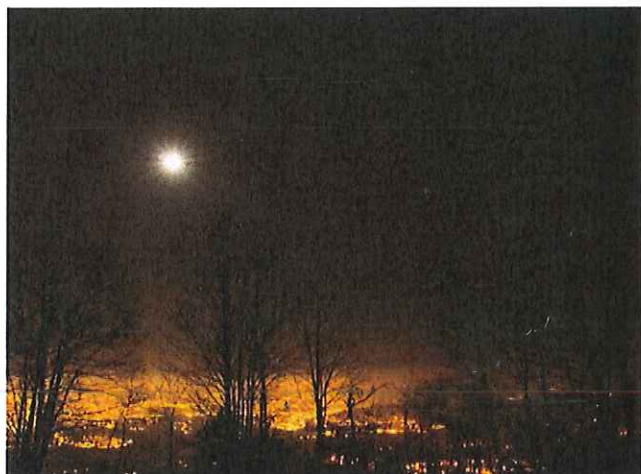
Lumières de la ville visibles depuis les espaces non urbanisés

Partant du principe que l'éclairage artificiel n'est par essence pas « naturel » et induit de fait une modification de l'environnement nocturne, un certain nombre de règles basiques peuvent être appliquées pour réduire ses effets négatifs quelle que soit la technologie considérée. Cela doit permettre une cohabitation nocturne plus harmonieuse entre l'Homme et les autres êtres vivants, dans une période où la biodiversité est particulièrement menacée. Ces règles, qui répondent aussi à d'autres enjeux comme la sobriété énergétique et la santé humaine, se fédèrent autour de la notion d'éclairage utile, maîtrisé et responsable.