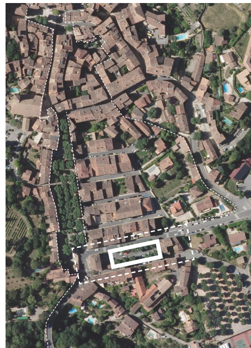
Vue aérienne du centre-village et de la Place Sigaud

Entre juillet et décembre 2021, des réunions d'échanges, des visites de terrain et un travail d'atelier ont permis de délimiter les contours du projet à venir, les fondamentaux et axes de programmes clairs. Assortis d'une approche chiffrée estimative élaborée en allers-retours constants avec la commune, l'objectif de la mission était d'accompagner la commune dans le lancement d'une mission de maîtrise d'oeuvre conduite par un groupement pluridisciplinaire.