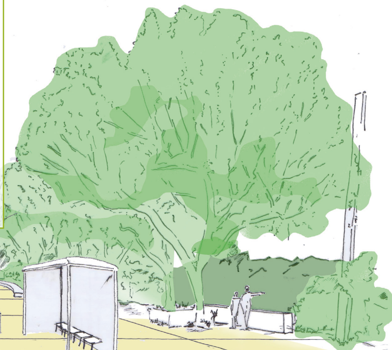
Croquis d'ambiance : exemple d'aménagement de l'espace public apaisé