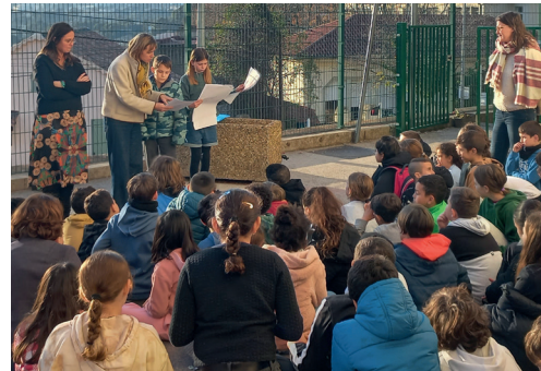
Atelier 'enfants' en janvier 2023

La collectivité a sollicité l'accompagnement du CAUE Var pour une intervention hybride, entre ateliers de sensibilisation et aide à la décision technique, sur le site de l'école Fort Rouge : une mission-pilote pour la Ville et pour le CAUE.