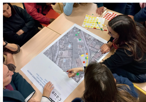
Atelier 'adultes' en janvier 2023

Le CAUE Var a organisé et animé des ateliers 'enfants' et 'adultes' (équipe pédagogique, gestionnaires, parents d'élèves, etc) dans une démarche participative et élaboré un dossier de conseil et d'aide à la décision avec des préconisations claires pour la suite du projet.